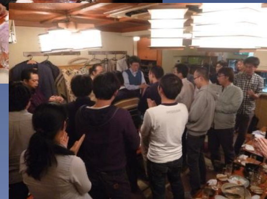
東京大学 小柴ホール